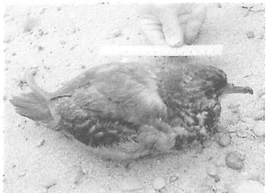
図2. 2005年5月24日に和歌山県白浜町番所崎で釣り糸にからまり漂着したハシボソミズナギドリ Puffinus tenuirostris .