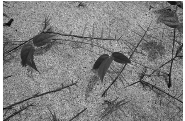
Fig.4 Mucuna gigantea on the beach in Iiramachi, Hirado City, Nagasaki Prefecture.