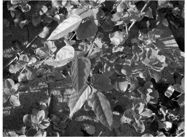
Fig.3 Mucuna sloanei on the beach in Nozakijima Island, Ojika-cho, Kitamatsuura-gun. Nagasaki Prefecture.