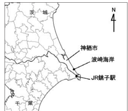
図1 茨城県神栖市波崎海岸の位置 (国土地理院地図改変)

発見時、本個体は既に一部がミイラ化しており、頭骨、右下顎、左右肩甲骨、右上腕骨、右尺骨を確認した（図2, 3）。本個体は上顎頬歯を6対有し、鼻骨最大幅と類して鼻骨長が短く、切歯骨（背側観）中央部の前後径が短かった。これらの特徴から阿部（2007）の記載に従い、キタオットセイと同定した。各部位の計測値は、頭骨長（切歯骨－後頭顆）179.0mm、頬骨弓幅99.6mm、右下顎骨長109.3mm、右肩甲骨背縁長132.4mm、左肩甲骨背縁長131.5mm、右上腕骨長（上腕骨頭－滑車）97.6mm、右尺骨長（肘頭－尺骨頭）118.6mmだった。また、